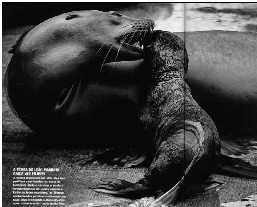
A FÊMEA DO LEÃO-MARINHO ATACA SEU FILHOTE. A fêmea produzida por uma alga que prolifera com rapidez na costa da Califórnia afeta o crescimento e muda o comportamento de várias espécies. Entre os leões-marinhos, as fêmeas contaminadas perdem o interesse por suas crias e chegam a atacá-las, logo após o nascimento, como nesta foto.